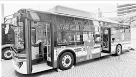
大型EVバスの自動運転実用化を目指す

自動運転は淀川左岸線2期区間と1期区間の海老名ジャンクション(JCT)―大開出入口を予定する。道路側に磁気マーカー、ターゲットライオンペイント(塗料)、検知センサー、通信機器類を設置し、高速道路における合流支援、先読み情報を受信などを行う。一方、車両は長さ10・5mの大型路線バスタイプを使用し、GPS(衛星利用測位システム)や周囲の状況を把握するセンサーを取り付ける方針