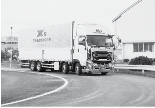
自動車教習所外周コースを周回

日本自動車工業会(片山正則会長)は10月15日から18日まで、幕張メッセ(千葉市美浜区)で「ジャパンモビリティショー」を主催し、2024年を期し、2030年の企業と団体が出展した。昨年、およそ70年の歴史を持つ東京モーターショーがジャパンモビリティショーへと生まれ変わった。ビジネスウィークは同ショーのビジネスステーションとして行われたイベントで、初めての試み。デジタルインベションの総合展「CEATEC(シーテック)」とも共催され、多くの業界人らが来場した。(関連記事7面)